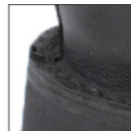
COUSU DOUBLE MONTAGE