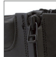
2 FERMETURES ZIP LATÉRALES